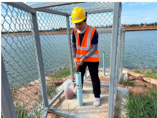
บริเวณบ่อสังเกตการณ์ที่ 7