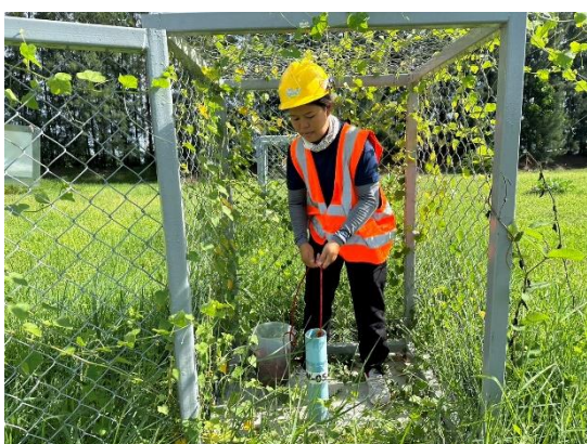
บริเวณบ่อสังเกตการณ์ที่ 5