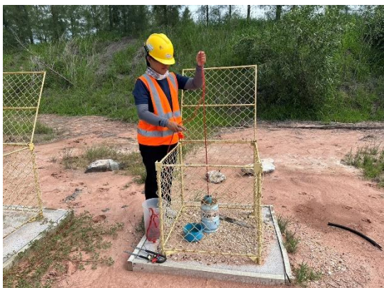
บริเวณบ่อสังเกตการณ์ที่ 9