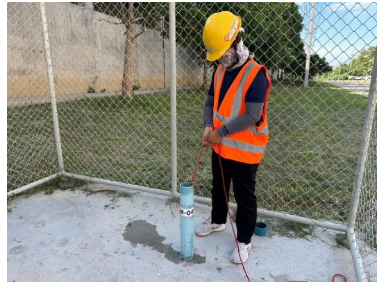
บริเวณบ่อสังเกตการณ์ที่ 4