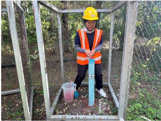
บริเวณบ่อสังเกตการณ์ที่ 1