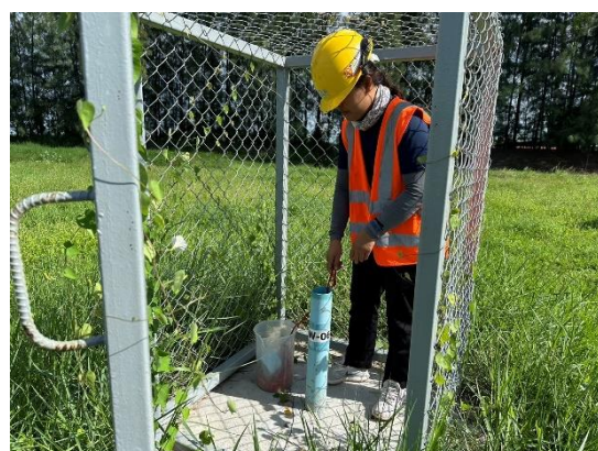
บริเวณบ่อสังเกตการณ์ที่ 6