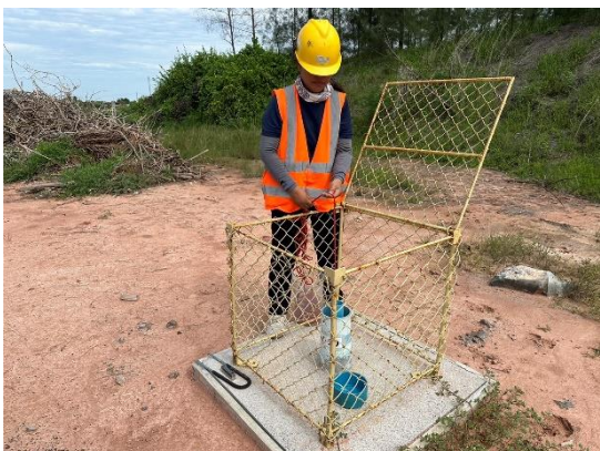
บริเวณบ่อสังเกตการณ์ที่ 10