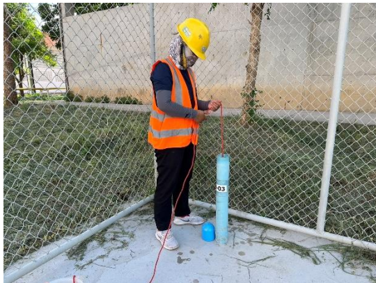
บริเวณบ่อสังเกตการณ์ที่ 3