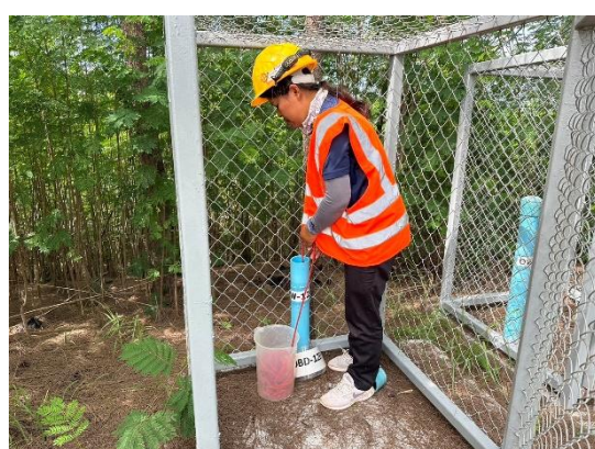
บริเวณบ่อสังเกตการณ์ที่ 12