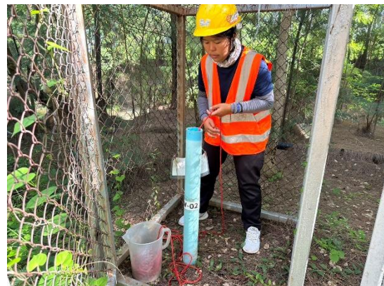
บริเวณบ่อสังเกตการณ์ที่ 2