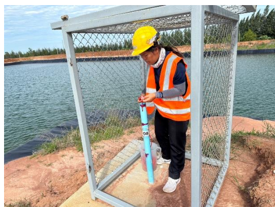
บริเวณบ่อสังเกตการณ์ที่ 8