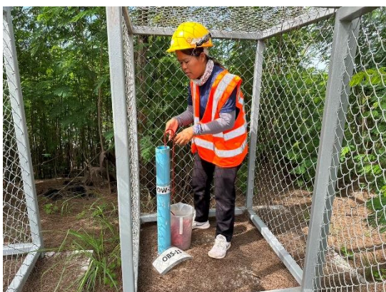
บริเวณบ่อสังเกตการณ์ที่ 11